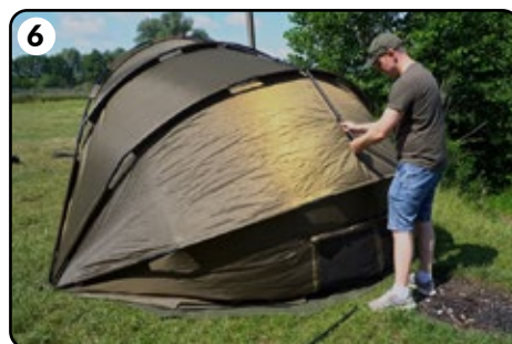
6 Setzen Sie nacheinander die nächsten Abstandshalter auf und befestigen Sie den Stoff daran.