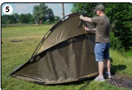
5 Treten Sie zurück und beginnen Sie mit der kürzesten Spitzenstrecke.