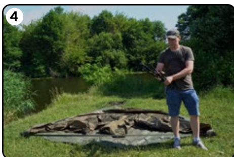
4 Klappen Sie die Zusatzstangen aus.