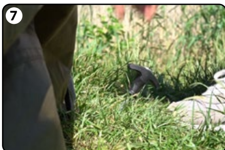
7 Befestigen Sie die Rückseite des Biwaks mit 3 Heringen.