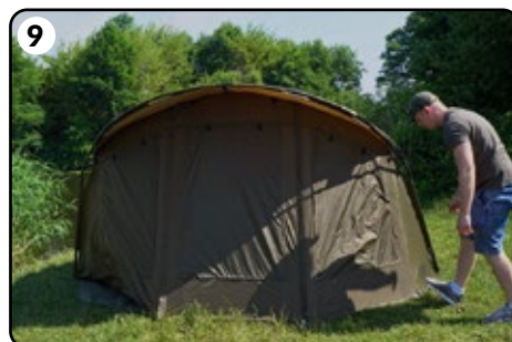
9 Befestigen Sie die Seitenwände mit zusätzlichen Heringen.