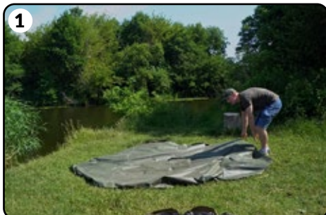
1 Klappen Sie die Bodenplane auf.