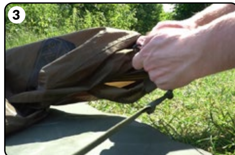
3 Befestigen Sie das Bivvy mit dem zusätzlichen Riemen.