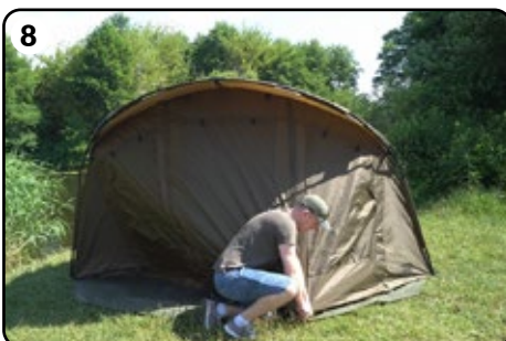
8 Gehen Sie zur Vorderseite des Biwaks und befestigen Sie die Tür mit zwei Heringen.