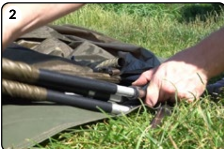
2 Verbinden Sie alle Stangen des Rahmens.